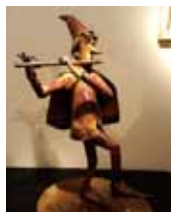
「ハメルンの笛吹き」 赤川 BONZE 作