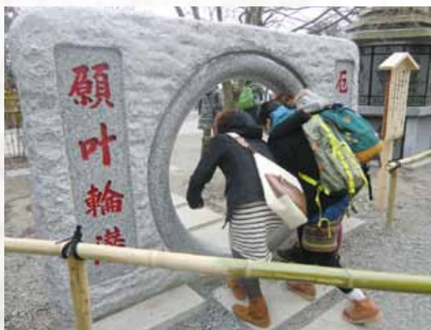
設計・施工/こがねや石材(株)

「輪をくぐれば願いが叶う」高尾山境内に石造りの「願叶輪潜」が建立されて、多くの人が列をなして、願いを掛けながら輪を潜り抜けて行きます。一度、立ち寄られてみてはいかがでしょうか。