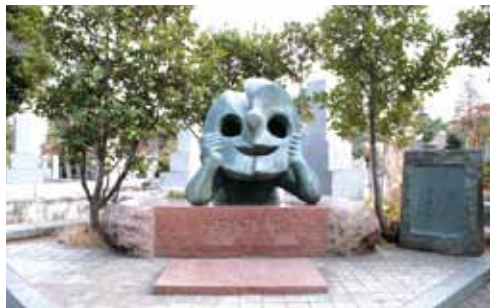
岡本太郎 (画家・彫刻家)