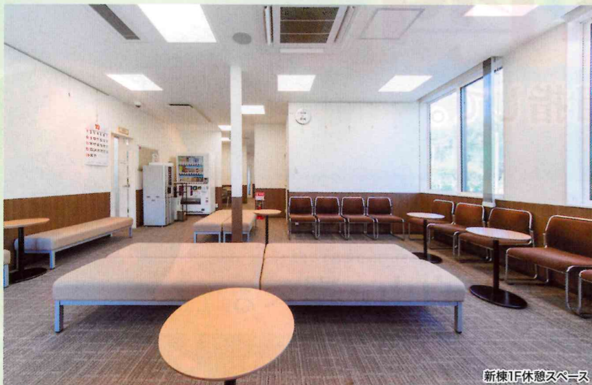
新棟1F休憩スペース