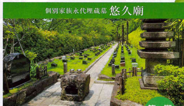
個別家族永代理蔵墓 悠久廟