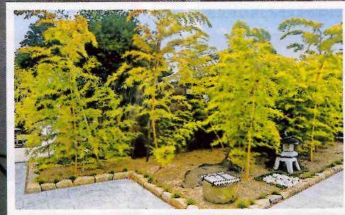
こだわりを感じる造形美

大小の石を極力加工せず組み上げる石垣は 石積み技法を得意とした匠の技を持つ石工 により造られています