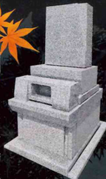
0.8㎡ 施工例 ※写真はイメージです