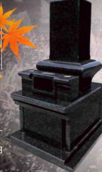
1.0㎡ 施工例 ※写真はイメージです