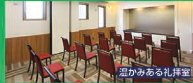
温かみある礼拝室