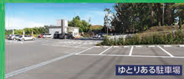
ゆとりある駐車場