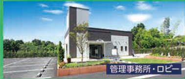
管理事務所・ロビー