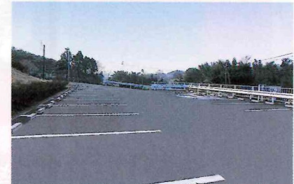
▲管理事務所(こちらでご休憩ができます。) ▲駐車場(大型で余裕があります。)